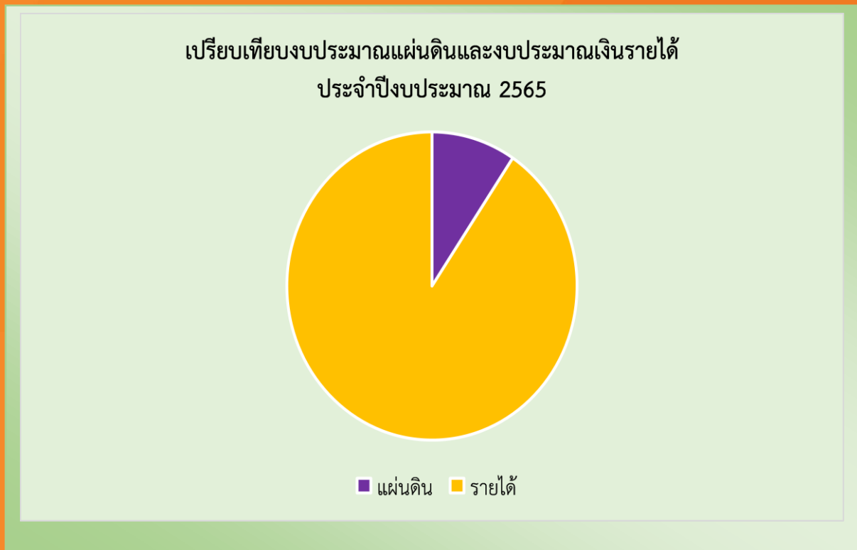
ตารางที่ 12 ภาพเปรียบเทียบงบประมาณแผ่นดินและงบประมาณเงินรายได้ ประจำปี

หมายเหตุ : ข้อมูล ณ วันที่ 30 กันยายนของทุกปี