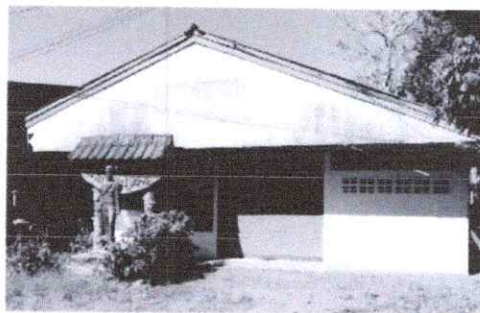
ภาพที่ 2 ศูนย์เรียนรู้ชุมชนบ้านนาบัวในปี พ.ศ. 2559

1.4 การวางแผนจัดการวัตถุภายในศูนย์การเรียนรู้ฯ ซึ่งมีอยู่เป็นจำนวนมากทั้งที่เป็นของแท้ดั้งเดิมและประดิษฐ์ขึ้นมาใหม่ วัตถุเหล่านี้ไม่ได้ถูกนำมาเล่าหรือเชื่อมโยงเรื่องราวเกี่ยวกับชุมชนมากนัก และยังขาดการวางแผนจัดการศูนย์การเรียนรู้ฯ ให้มีทิศทางการดำเนินงานที่ชัดเจน เพื่อวางโครงเรื่องเล่าที่นำไปสู่การกำกับการจัดวางวัตถุภายในศูนย์การเรียนรู้ฯ