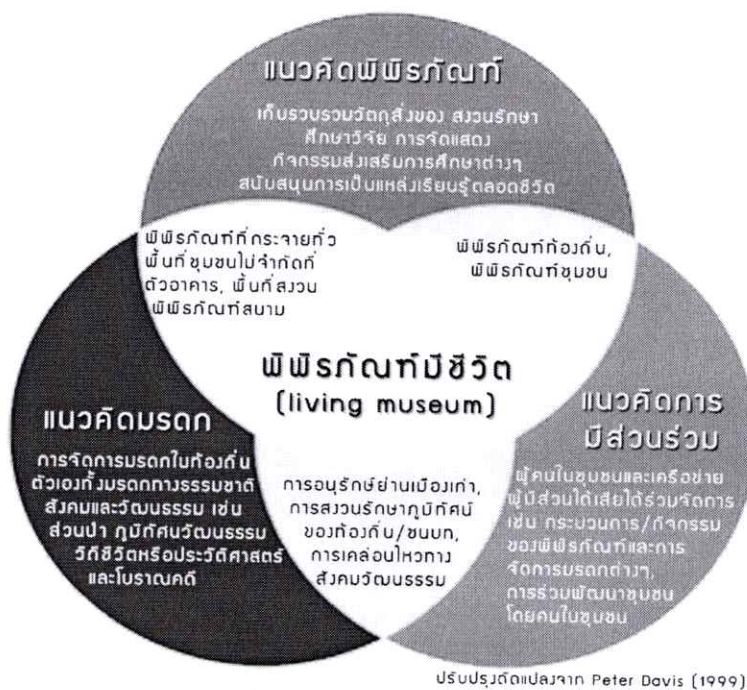
ภาพที่ 1 แนวคิดพิพิธภัณฑ์มีชีวิต

จะเป็นการจัดการทั้งสถานที่ (site) และวัฒนธรรมต่างๆที่เกี่ยวข้องกับสถานที่นั้นๆไปด้วย เพราะมรดกทางวัฒนธรรมเหล่านี้มีความสำคัญต่ออัตลักษณ์ของชุมชนท้องถิ่นและวิถีชีวิตของชาวบ้าน